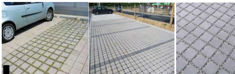
Pavés non jointifs engazonnés ou gravillonnés