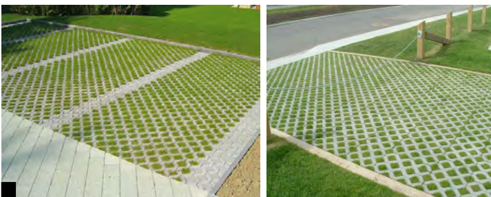
Structure béton alvéolé engazonnée