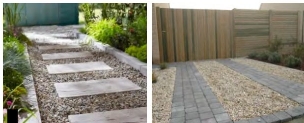
Bande de roulement pavés ou dalle avec complément en gravillon