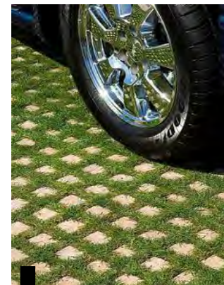
Structure plot béton engazonnée