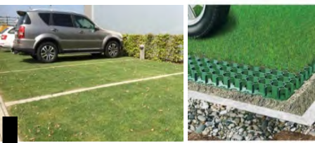
Structure nid d'abeille engazonnée