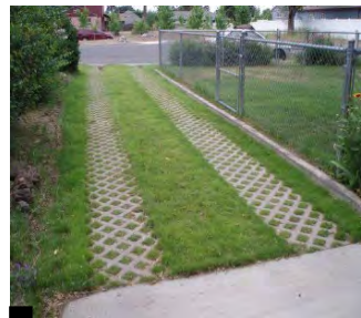
Structure béton alvéolée avec bande de roulement