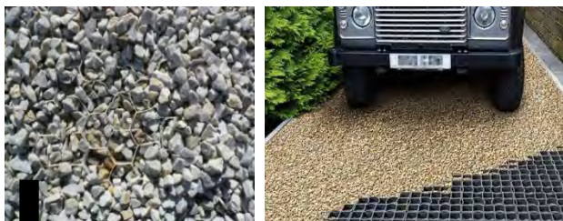
Structure nid d'abeille remplie de gravillons