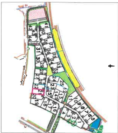
Plan général du lotissement - sans échelle