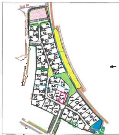
Plan général du lotissement - sans échelle