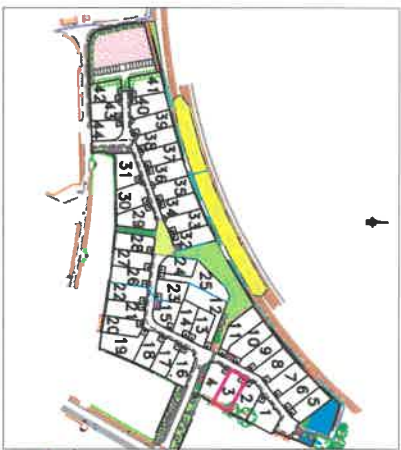
Plan général du lotissement - sans échelle