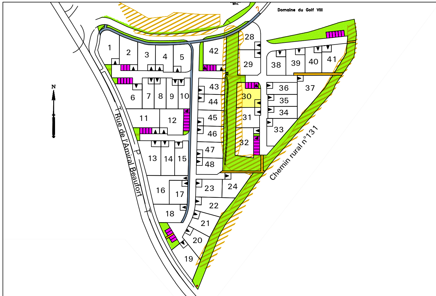
Plan général du lotissement - sans échelle

Modifié le 17 Avril 2019 par: Dessé le 03 Novembre 2017 par: