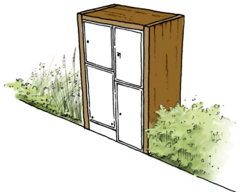
Habillage bois partiel (illustration à titre indicatif)

Les coffrets techniques, dont les emplacements figurent au règlement graphique (PA 10-1) devront être respectés. Il est conseillé d'y associer un habillage adapté pour assurer leur intégration (à titre d'exemple, un encadrement bois pourrait être réalisé) :