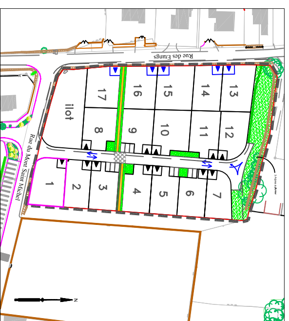
Plan général du lotissement - sans échelle