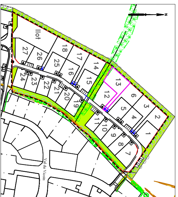
Plan général du lotissement - sans échelle