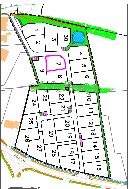
Plan général du lotissement - sans échelle