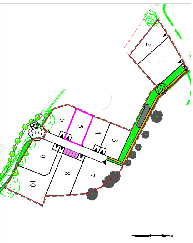
Plan général du lotissement - sans échelle