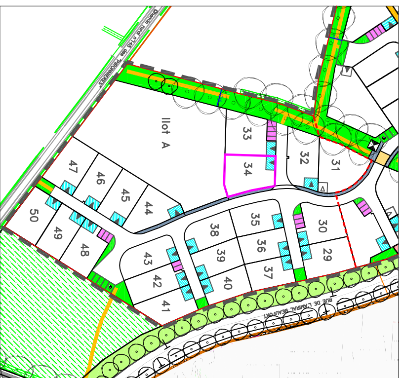
Plan général du lotissement - sans échelle