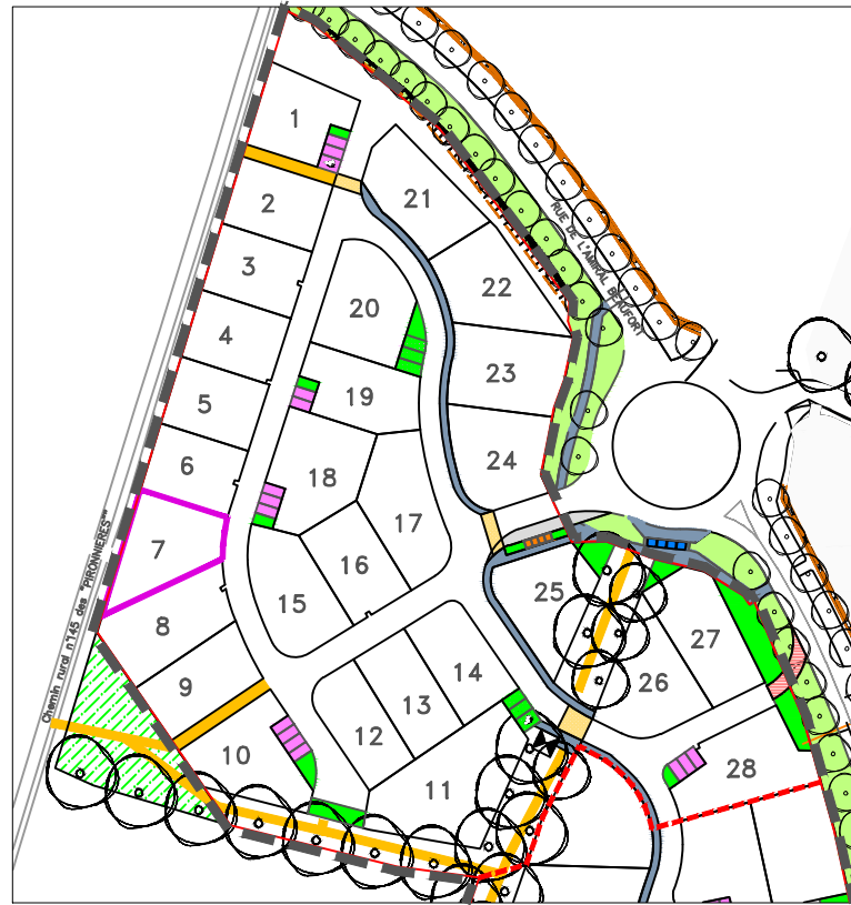
Plan général du lotissement - sans échelle

Superficie : 465 m 2 Cadastre : ZY n° 440